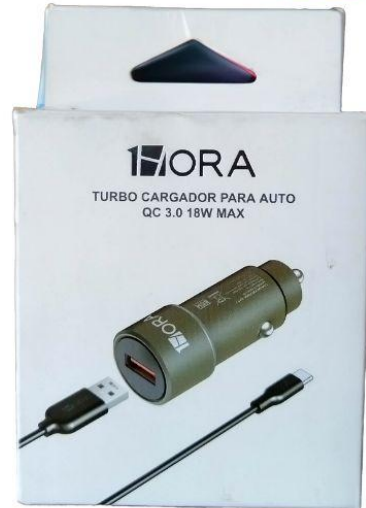
Cargador para Carro Q60.00