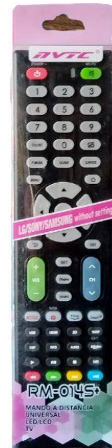
Control universal (PARA YODAS MARCAS) Q35.00