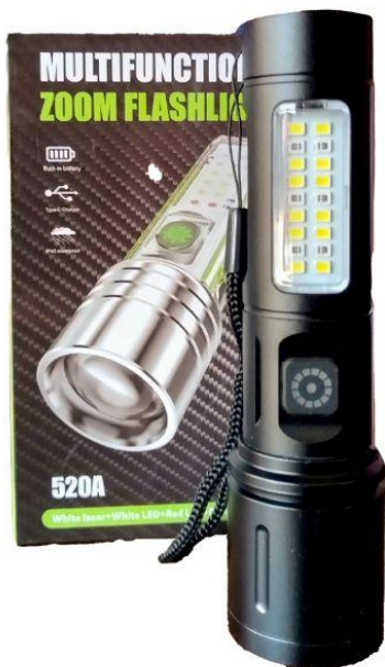
Linterna táctil 20mts de alcance Q65.00