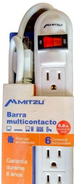
Regleta varias entradas Q25.00