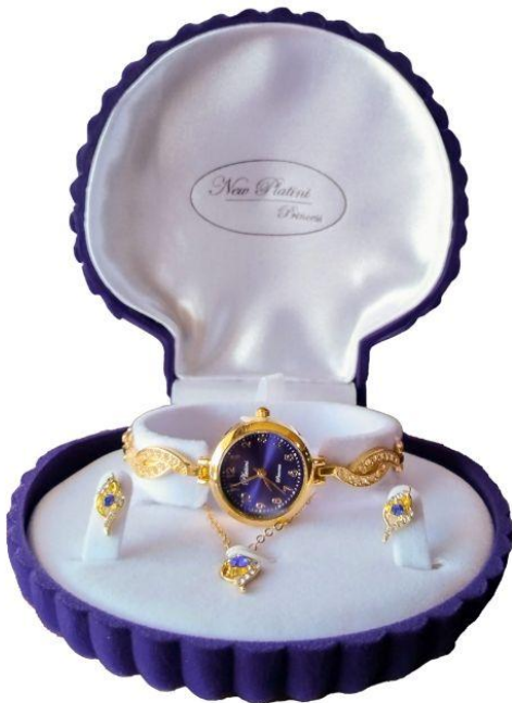
Reloj de dama combo pulsera reloj aretes Q150.00