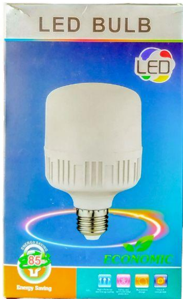
Foco Led 48w Q50.00