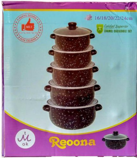
Set de 5 ollas Q175.00