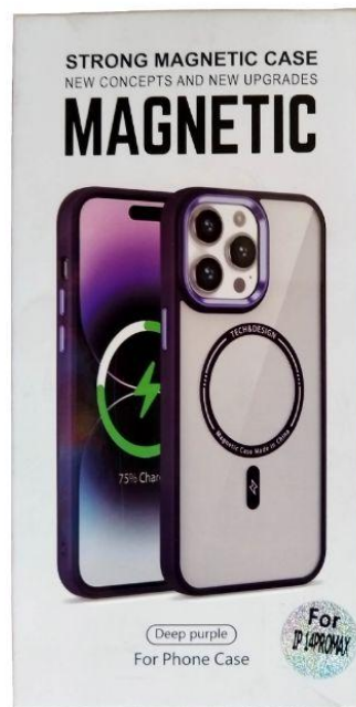
Estuche protector de todos modelos Q35.00