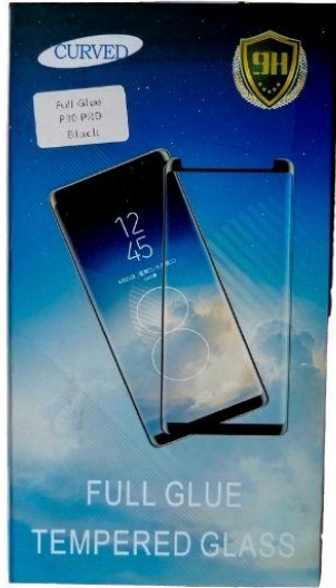
Vidrio templado para todos modelos Q20.00