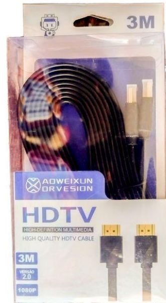
Cable HDMI Q35.00