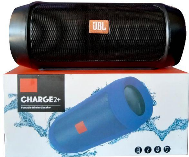
Bocina jbl inalámbrica Q150.00