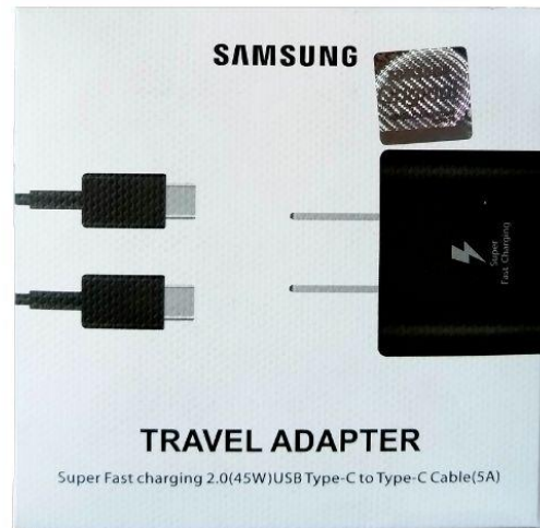
Cargador original samsung Q150.00