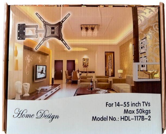
Soporte para tv movable Q150.00