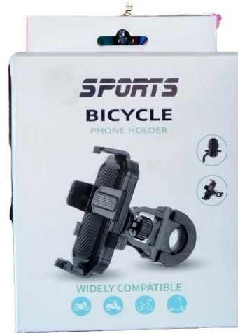
Soporte para celular para Moto y Carro Q35.00