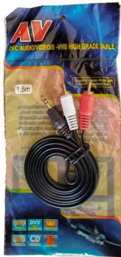
Cable RCA Q175.00