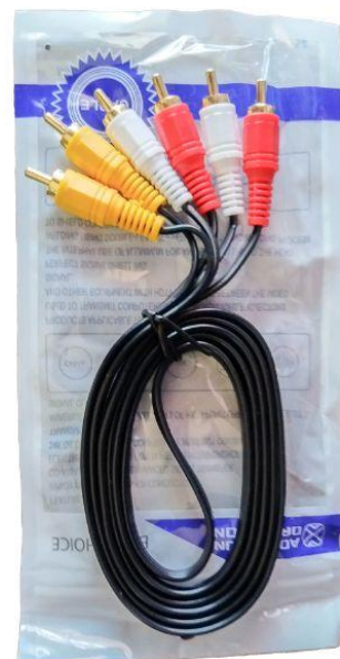
Cable para DVD Q15.00